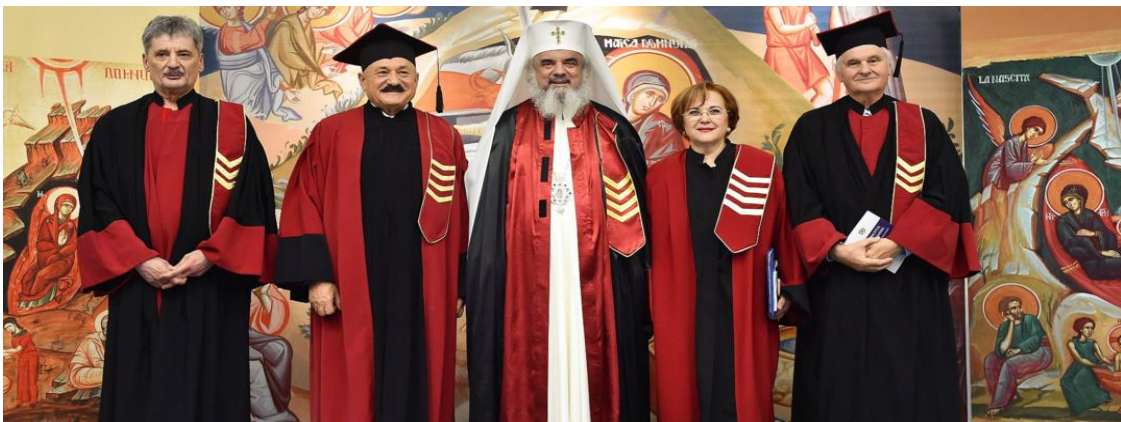
Parintele Patriarh Daniel a primit titlul de Doctor Honoris Causa la Universitatea Titu Maiorescu